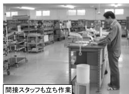
間接スタッフも立ち作業